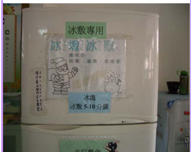
提醒學生善用冰敷