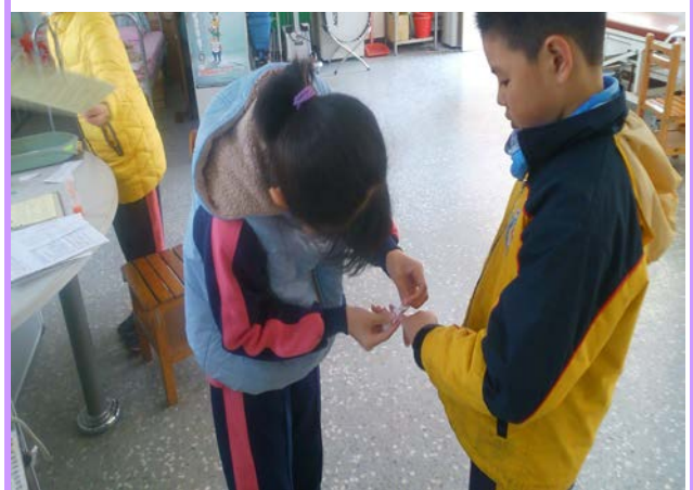
小護士協助簡易傷口包紮