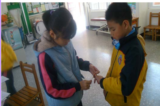
小護士協助簡易傷口塗擦外用藥