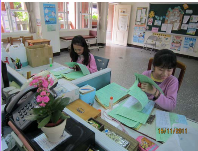
小護士協助整理各類健康檢查回條